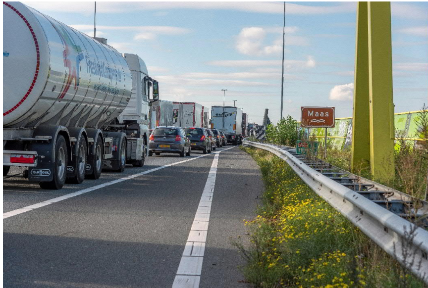
File bij de brug over de Maas